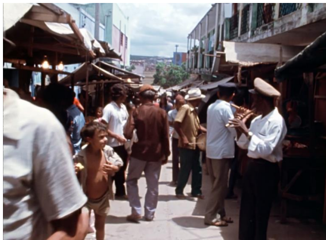
Figura 3: Banda de Pífanos, Feira de Caruaru, agreste pernambucano, janeiro de 1976.

/.../ o importante é permitir que as outras forças criadoras que já existem, tão sedimentadas, de um perfil cultural próprio do país não seja obstruído, que permaneça e que o intercâmbio, digamos, se faça de tal maneira que se possa enriquecer a cultura com que vem permanentemente de fora, ao natural, e ao mesmo tempo que as linhas evolutivas e a força criadora que está na própria cultura brasileira, na verdadeira cultura brasileira, essa continue a atuar sobre um todo e a enriquecer um todo. Só se é grande no Brasil se se tem raízes populares, só o povo no Brasil que tinha cultura, isso é importante.