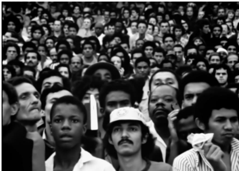
Figura 1: A “geral” e os “geraldinos” no Maracanã da década de 1970. O espaço foi extinto na reforma do estádio para a Copa do Mundo de 2014.

estatísticas mostram que as residências brasileiras possuem mais televisores que outros aparelhos de primeira necessidade, entender a penetração da cultura de massas antes da internet era, como mostra Furtado, essencial para se entender os problemas que um país desigual e dependente como o Brasil enfrentava naquele momento e que se perpetuam ainda hoje.