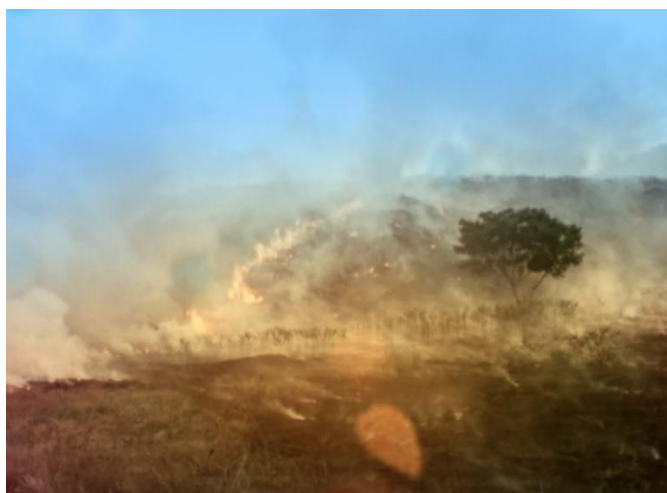
Figura 4: Queimadas ao longo da BR101Rio-Bahia, dezembro de 1975.

/.../ Portanto existe primeiramente uma dominação cultural que abarca, que assume várias formas, é uma dessas formas é a dominação econômica. No Mito existe uma tese, que eu creio, que se pode quase hoje em dia demonstrar empiricamente, é que a civilização material criada no mundo ocidental, digamos assim, criada num mundo capitalista mas com grande parte está sendo também reproduzida no mundo socialista, digo uma situação material, essa civilização corresponde a um grau de acumulação de capital e há uma utilização intensiva de recurso não renováveis em tal escala ou em escala tal que se pretender-se generalizar essa civilização em escala planetária, teríamos evidentemente que enfrentar um colapso total, digamos, ecológico. (Ibidem)