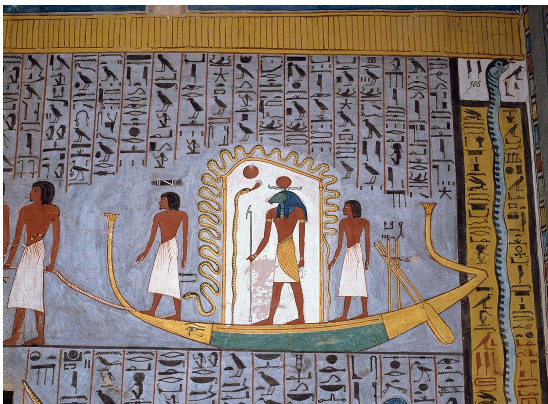
FIGURA 5: O BARCO SOLAR de Amon-Ra (o “Sol Oculto”) Tumba de Ramsés I (1292-1189 a.EC): Vale dos Reis, Tebas, Egito. 68