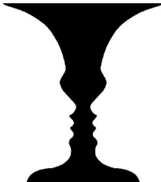
FIGURA 1: EXPERIMENTO DE GESTALT: CÁLICE-CASAL

paradigma” que constitui uma verdadeira revolução na ciência é cognitivamente análoga aos experimentos de figura-fundo, onde a atenção do observador pode alternar entre as múltiplas imagens possíveis de uma forma. Para ele, a passagem da física aristotélica para a newtoniana, e desta para a relativística e quântica, é o equivalente epistemológico da experiência de olhar para a taça abaixo e descobrir o casal escondido na imagem, ou vice-versa: